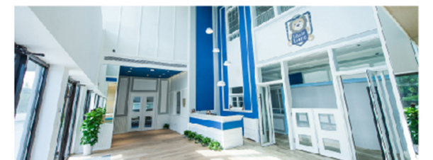
上海哈罗小狮幼教中心 Harrow Little Lions Shanghai