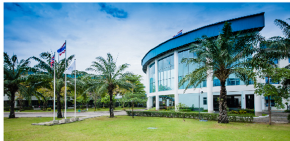
哈罗曼谷 Harrow Bangkok

AISL Harrow Schools Group brings World-class Early Years Education on Your Doorstep