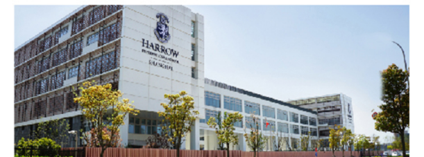
哈罗上海 Harrow Shanghai