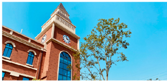
哈罗重庆 Harrow Chongqing