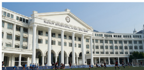
哈罗香港 Harrow Hong Kong