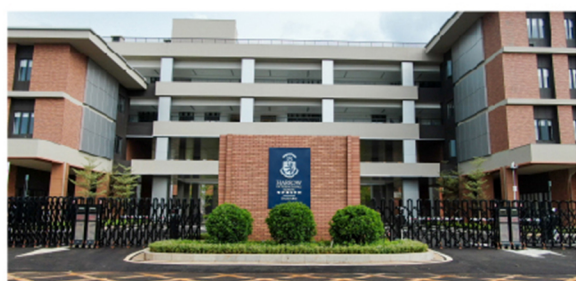
哈罗海口 Harrow Haikou