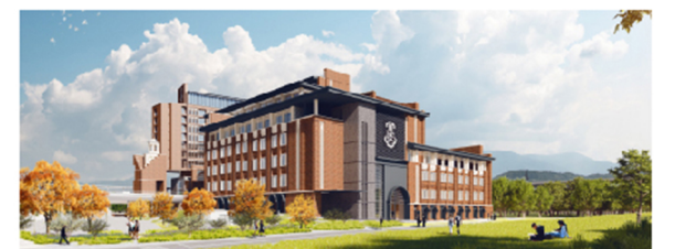
哈罗深圳 Harrow Shenzhen