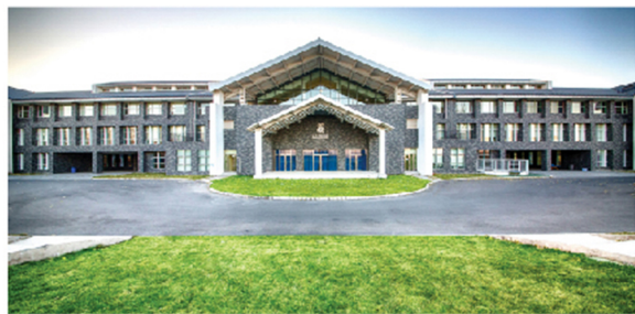
哈罗北京 Harrow Beijing