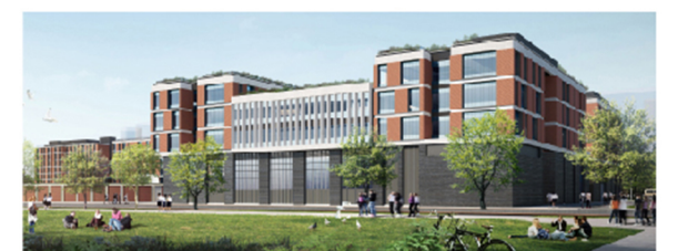
哈罗珠海 Harrow Zhuhai