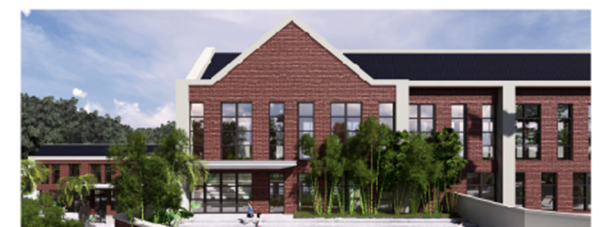
珠海香洲哈罗小狮幼教中心 Harrow Little Lions Xiangzhou, Zhuhai