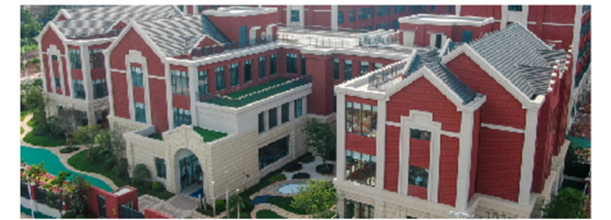
哈罗南宁 Harrow Nanning